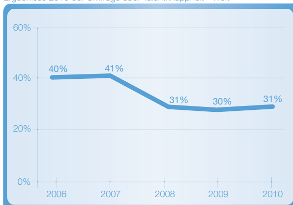
Anteil Arbeitgeber mit Schwierigkeiten bei der Stellenbesetzung. Ergebnisse 2010 der Umfrage über Talentknappheit - Welt

Die grössten Schwierigkeiten, qualifizierte Arbeitskräfte zu finden, haben Arbeitgeber in Japan (76%), Brasilien (64%), Argentinien (53%), Singapur (53%) und Polen (51%). Am wenigsten von der Talentknappheit betroffen sind Irland (4%), das Vereinigte Königreich (9%), Norwegen (11%), die Vereinigten Staaten (14%) und Spanien (15%).