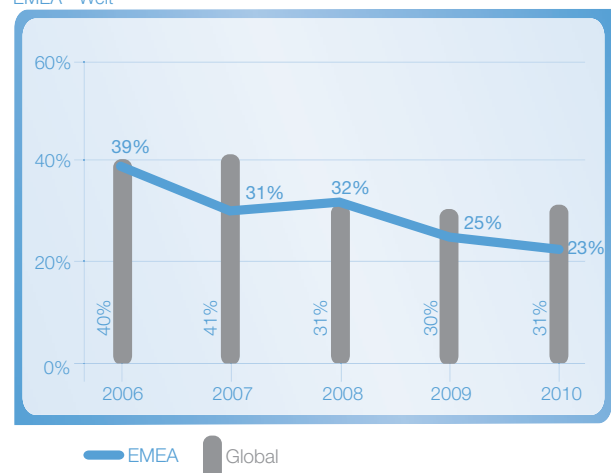
Anteil Arbeitgeber, welche nicht ausreichend Personal finden. EMEA - Welt

Die grössten Schwierigkeiten bei der Stellenbesetzung haben in der EMEA-Region die Arbeitgeber in Polen (51 %), Rumänien (36 %), Österreich (35 %) und der Schweiz (35 %). Am wenigsten spürbar ist die Talentknappheit in Irland (4 %), im Vereinigten Königreich (9 %) und in Norwegen (11 %).